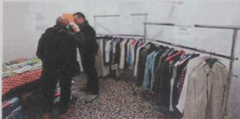
Il reparto vestiti del mercato anti crisi

zione di promozione sociale senza fine di lucro che si ispira al coraggio delle singole persone, ai principi di libertà e indipendenza e alla volontà di scongiurare le situazioni di indigenza temporanea e continuativa dei cittadini della città. Si ispira ai principi della solidarietà, preferendoli ai principi della carità occasionale.