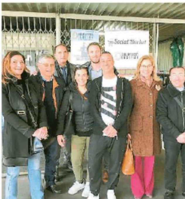
Foto di gruppo per l'inaugurazione del Social Market alle Jare