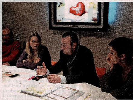
La conferenza di presentazione del Social Market

Primo social market per famiglie in difficoltà: prodotti prossimi alla scadenza a prezzi agevolati