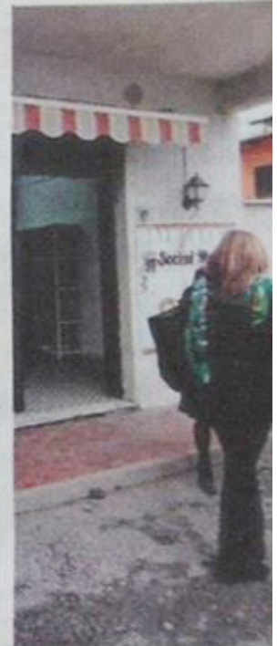
Il social market in via Catagnina

mentato dalla finanziaria del 2008 che regola i gruppi d'acquisto, nasce solo ed esclusivamente per combattere in maniera completa ed esaustiva quelle situazioni che la vita può, purtroppo, riservare a tutti. È proprio stando in mezzo alla gente comune che si recepisce quel senso di amarezza, quel senso di impotenza di fronte alla per-